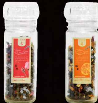
ローズマーガオ (薔薇&クリスタル岩塩)